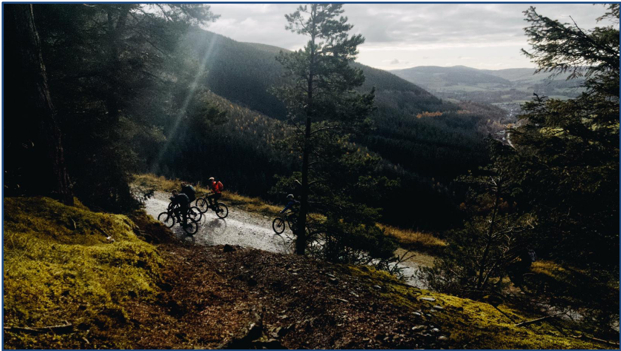
Dit is de reden dat we in november naar Schotland gaan!

Of we gek zijn geworden om in november een reis naar Schotland te organiseren? Terechte vraag, maar de waarheid is dat het in Schotland een stuk minder regent in november dan in Nederland. Als je de statistieken bekijkt is de kans op regen in Schotland het hele jaar ongeveer hetzelfde en daarom maakt het eigenlijk niet uit in welk seizoen je hier bent, in de zomer is de kans op regen net zo groot. Uiteraard moeten we met alle omstandigheden rekening houden en daarover lees je verderop meer, maar het fantastische is dat de trails onder alle omstandigheden perfect te rijden en het landschap en de uitzichten zijn in november fantastisch zoals je op de foto's in dit Roadbook kunt zien.