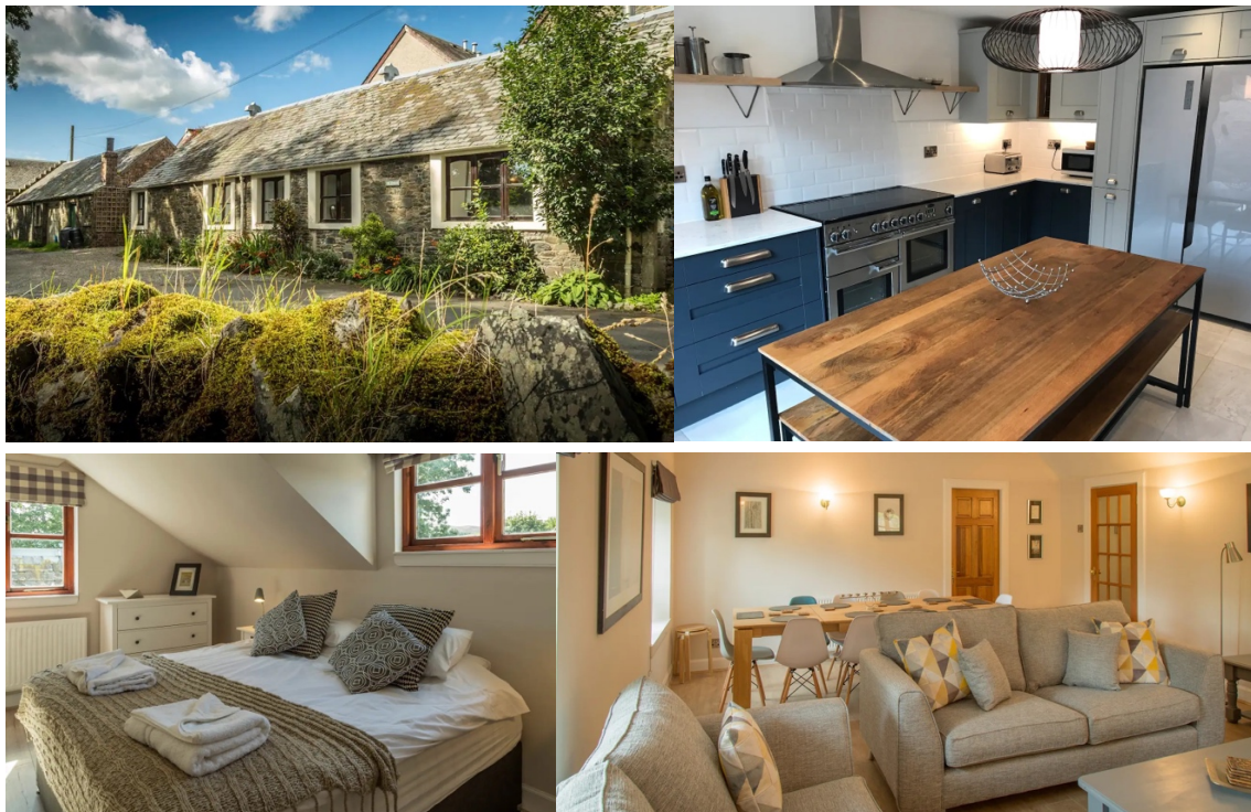
Het appartement waar we verblijven: