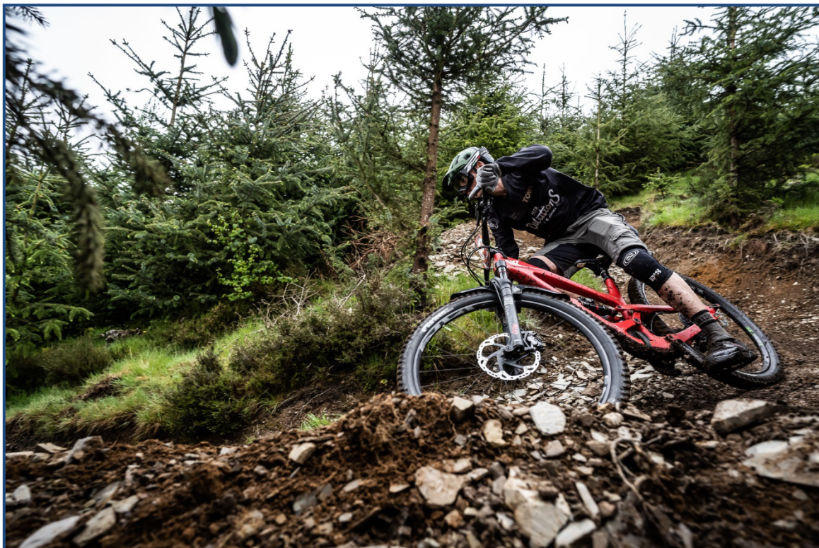
Volgas naar beneden tijdens de Scottish Enduro Series 2019